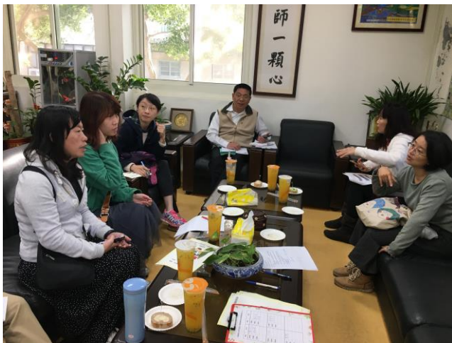
決議學校本位課程安排