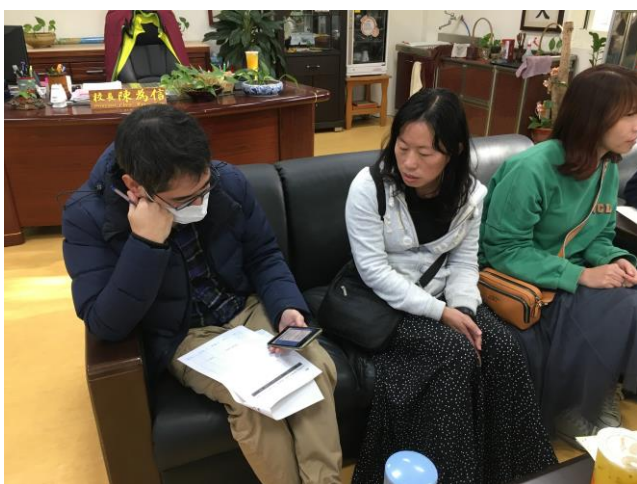
確認後續年度彙整學校