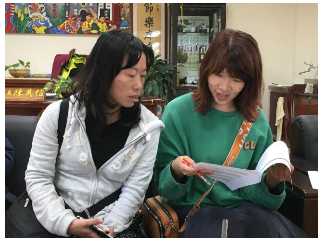
湖區週三進修共同規劃